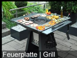
Feuerplatte | Grill