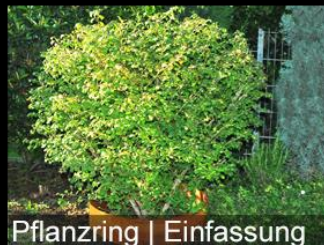
Pflanzring | Einfassung