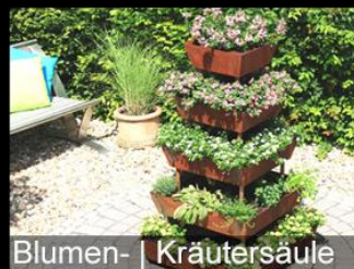
Blumen- | Kräutersäule