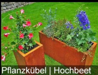
Pflanzkübel | Hochbeet